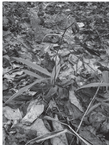
図3 前年の果茎を残した早春の コケイラン 2020.4.7 恵庭公園