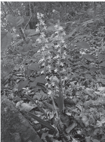
図2 花期のコケイラン 2020.6.10 日高町