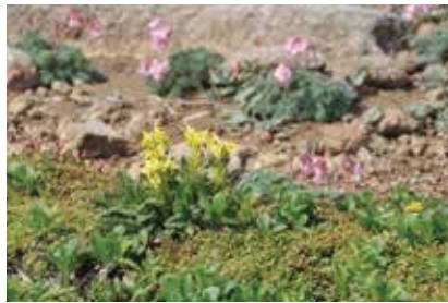
キバナシオガマ (背後はコマクサ) (本)