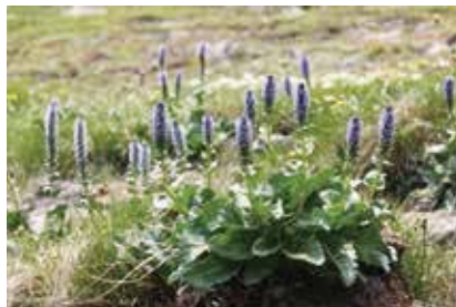
ホンバウルップソウ (新)