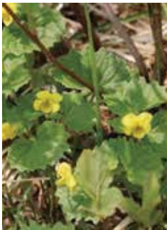
ジンヨウクスミレ (新)