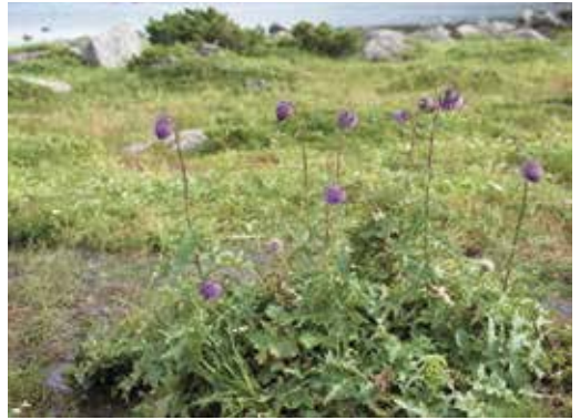
エゾノミヤマアザミ