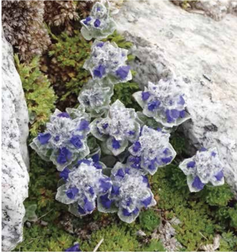
ヴェロニカ・ラヌギノサ ( Veronica lanuginosa ) 2018年7月20日 ネパール中部マナスル山群 標高5100mで