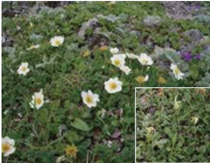
チョウノスケソウ 右は果実 (新)