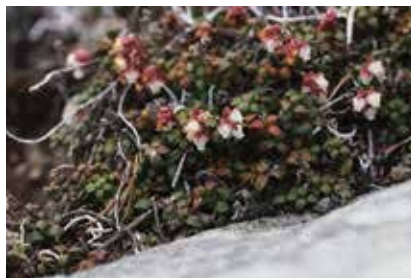
コメバツガザクラ (新)