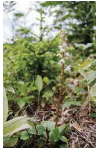
カラフトイチヤクソウ