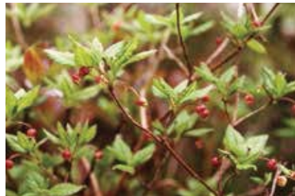
コヨウラクツツジ