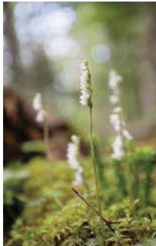
ヒメミヤマウズラ