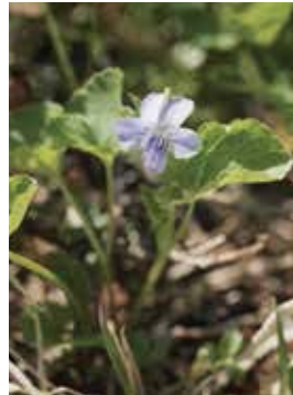
タカネタチツボスミレ