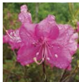
ムラサキヤシオツツジ