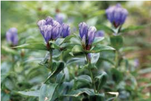
エゾオヤマリンドウ