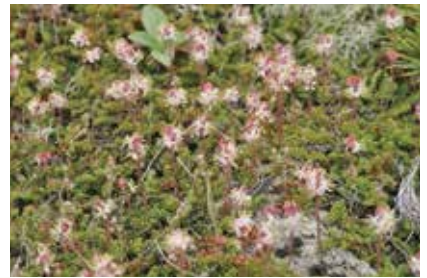
チシマツガザクラ (本)