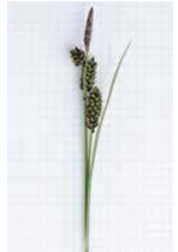
ラウススゲ (方眼は 3mm 幅)