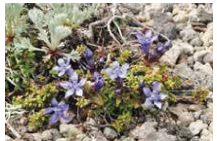
リシリリンドウ (本)