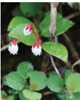
アカモノ (撮影：新田)