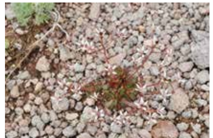
クモユキノシタ (本)