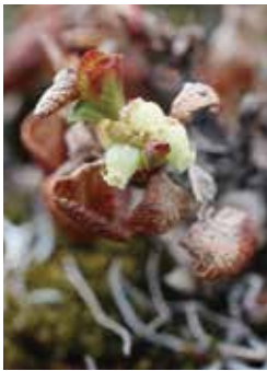
ウラシマツツジ (新)