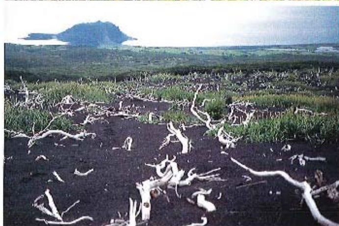
アライト島東海岸部 300m付近、火山灰により白炭化したミヤマハシノキ。妙州でつながった北海道が遠望できる (1997年8月12日)