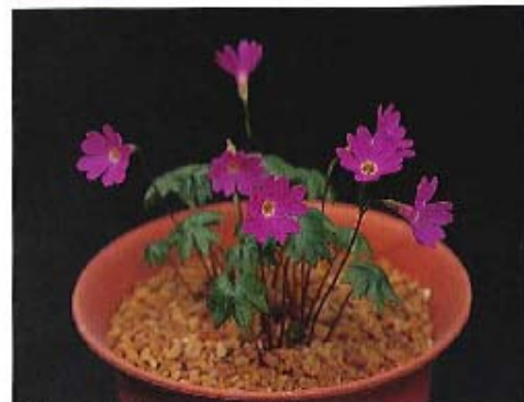
赤花デシオコソクラ・アルム観色株