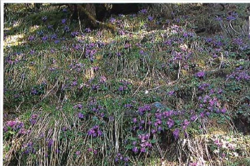
プリムラ・グラキリベス (ネバル ランタン国立公園ゴブア付近で)