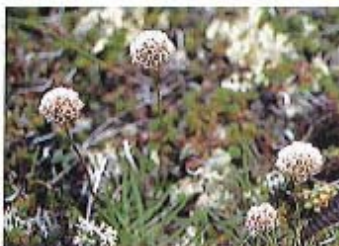
チシマハマカンザシ Armeria maritima subsp. arctica (シュムシュ島, 1997年6月8日)