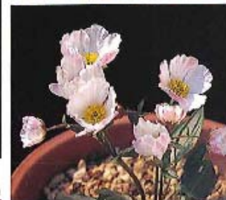
クモイナデシコ「くれぬい」