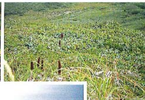
十ヶ所のミヤマハシノキ (写真真ん中あたりの大きな葉) とそれを成いでマツオニク (マカシル島、1997年8月13日)