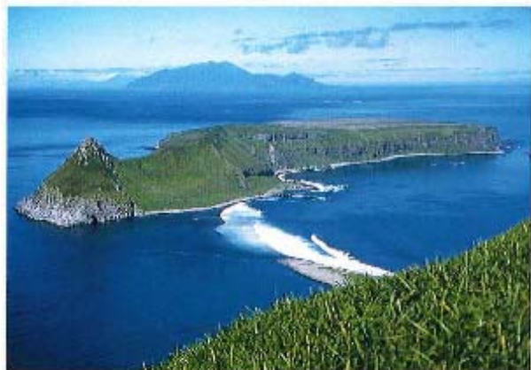
ウシシル南島より北島を望む 北にラシュウ、マツウ島を望める (1997年6月1日)