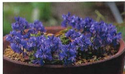
ポリガラ・カルカレア・リレット